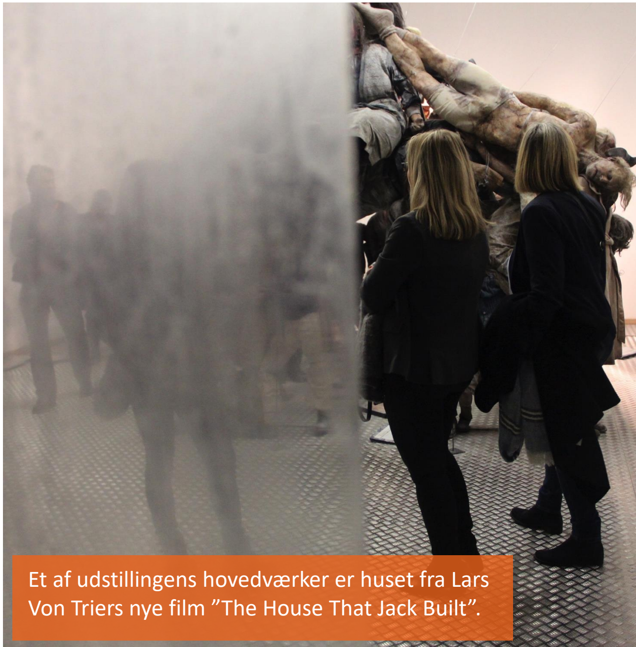
Et af udstillingens hovedværker er huset fra Lars Von Triers nye film "The House That Jack Built".